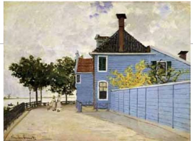
▲ Het beroemde schilderij Het Blauwe Huis van Monet.

Op basis van Schuster zijn verfonderzoek zal huiseigenaar Engel binnenkort vergunning aanvragen om de oostelijke gevel van het rijksmonumentale pand in de blauwe kleur te laten schilderen. De gemeente Zaandstad is positief over het plan en is bereid een deel van de kosten op zich te nemen. Stichting Monet gaat