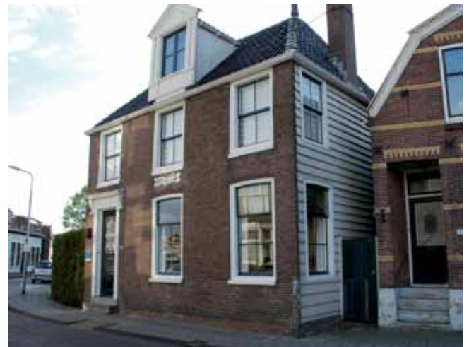
▲ Het Blauwe Huis met de geplankte zijgevel, anno 2012.

nu op zoek naar een of meerdere sponsors die eveneens een bijdrage willen leveren aan de inkoop van de verf en de uitvoering van het schilderwerk. •